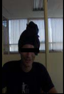
Bibliotecario fundamentalista, o devuelves los libros o pillas cacho...