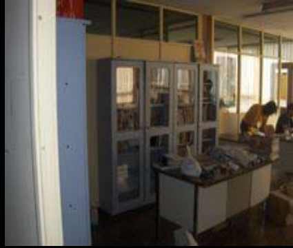
La gente currando