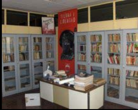
Algunas fotos de lo que se hace

De un tiempo para acá estamos un grupo de jóvenes anarcosindicalistas, reorganizando la biblioteca del sindicato. Subiendo libros y catalogando durante todo el verano, para tener un espacio de lectura, así que dentro de poco realizaremos un acto de inauguración de la biblioteca , de momento publicamos unas fotos del trabajo que se viene realizando durante agosto y septiembre. Por otra parte todos los jueves se seguirá con el taller de serigrafía. Salud y Anarcosindicalismo.